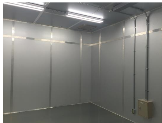
空調開口(ハニカム)